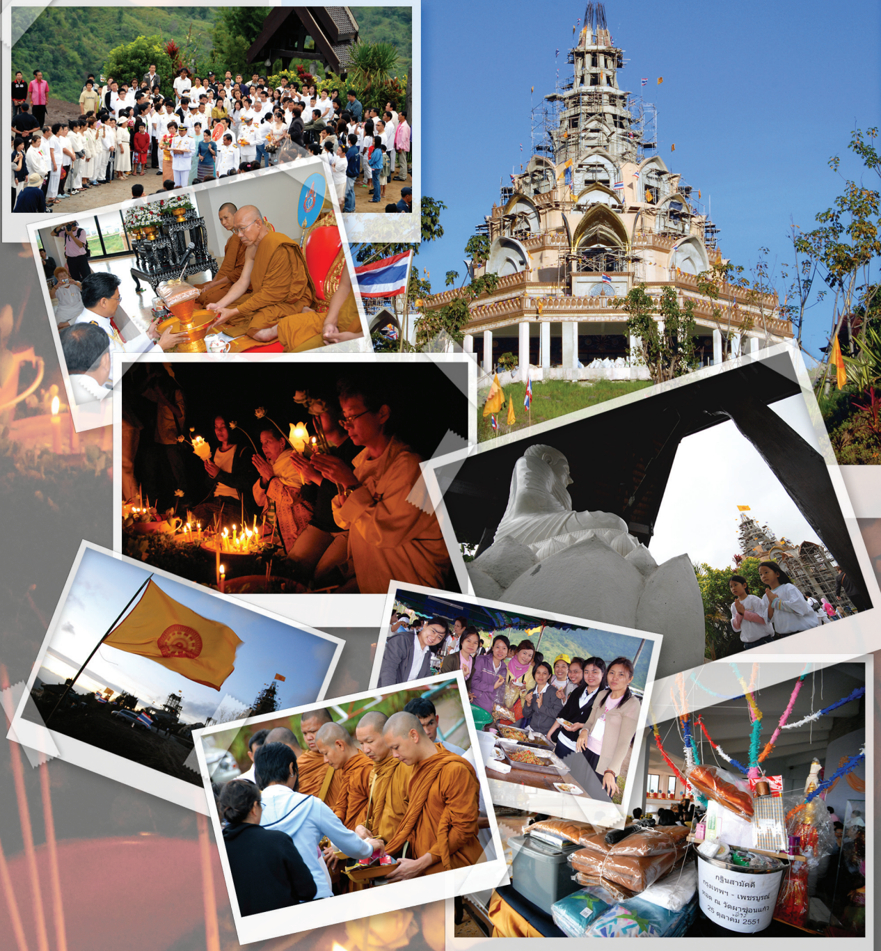
ภาพถ่ายจากงานกฐินพระราชทาน ประจำปี ๒๕๕๑

ขอเชิญร่วมงานกฐินสามัคคีประจำปี ๒๕๕๒ เพื่อจัดสร้าง “เจดีย์พระธาตุผาซ่อนแก้ว สิริราชย์ธรรมนฤมิต” ณ วัดพระธาตุผาซ่อนแก้ว จ. เพชรบูรณ์ รายละเอียดเพิ่มเติม Call center มูลนิธิบ้านอารีย์ โทร. ๐ ๒๓๓๓ ๓๓๖๖