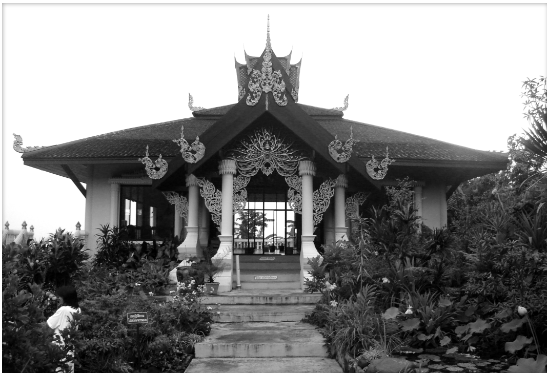
ศาลาปฏิบัติธรรม ณ พุทธธรรมสถานผาซ้อนแก้ว อ.เขาค้อ จ.เพชรบูรณ์